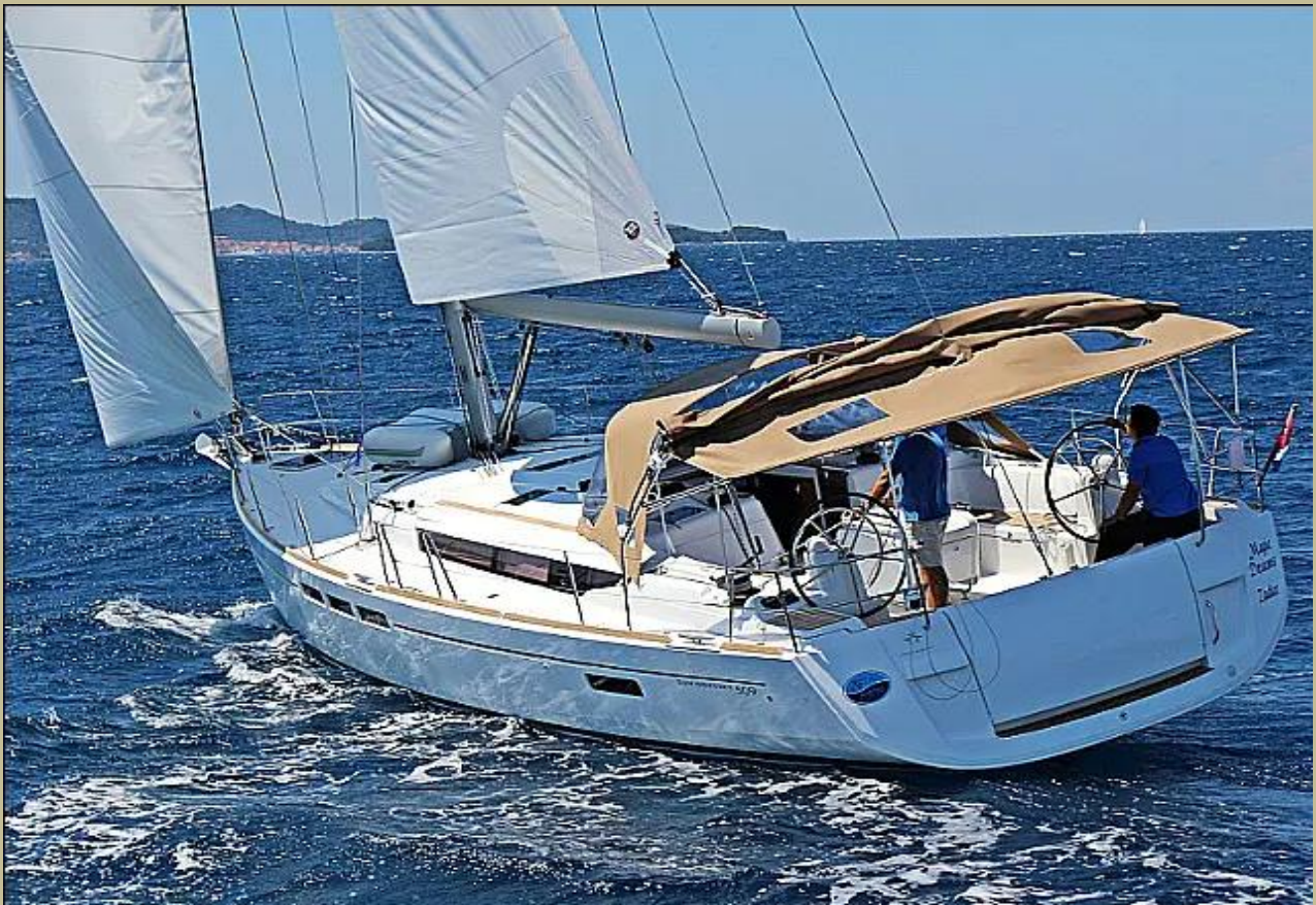
3WC- Duschräume innen und zusätzlich noch eine Außendusche auf Badeplattform