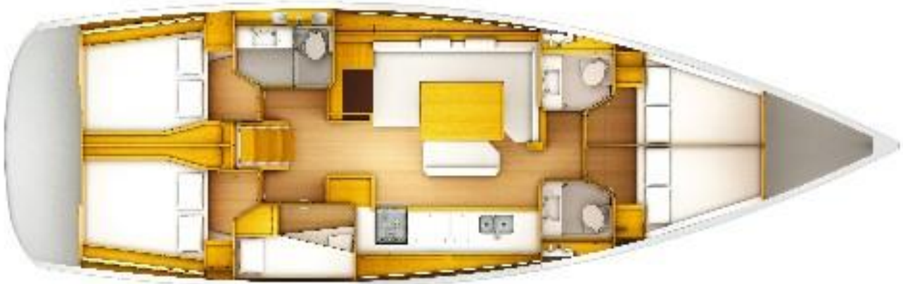
5 komfortable Doppelkajüten, die beiden Bugkajüten mit eigenem WC-Duschraum..